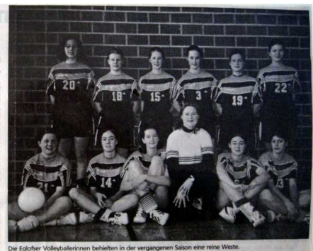
Die Eglofser Volleyballerinnen behielten in der vergangenen Saison eine reine Weste.